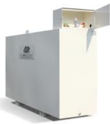
Art. nr. 10057