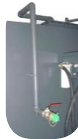
Art. nr. 10042