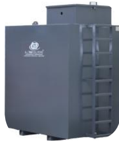
Art. nr. 10041